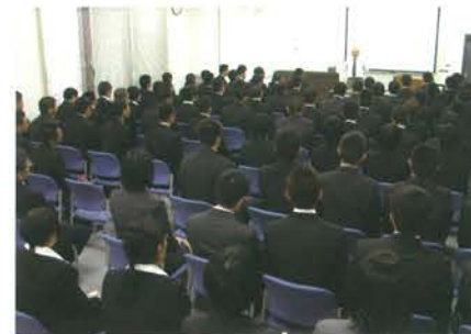
(飛行機「隼」前 収容人員 約250人) (視聴覚室 収容人員 約200人) (講話室 収容人員 約100人)

※ 220名以上の場合、隣接する知覧文化会館(収容人員 約700名)も調整により使用できます。