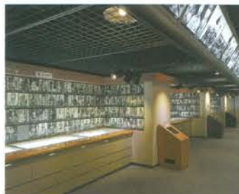
遺品室「遺影コーナー」